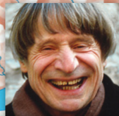
CLOWN DIMITRI VERSCIO FORMATION PROF. INITIALE : POTIER

« Dans nos centres de formation, des responsables de la formation à plein temps soutiennent les apprenants. Les bons résultats régulièrement obtenus dans les concours des métiers prouvent la grande qualité de notre formation professionnelle. En 2010, deux de nos apprenants ont été sacrés champions suisses. Ils participeront au Mondial des métiers 2011 à Londres. »